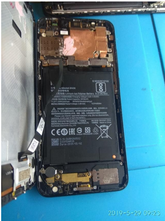
Imagem 1: aparelho totalmente violado