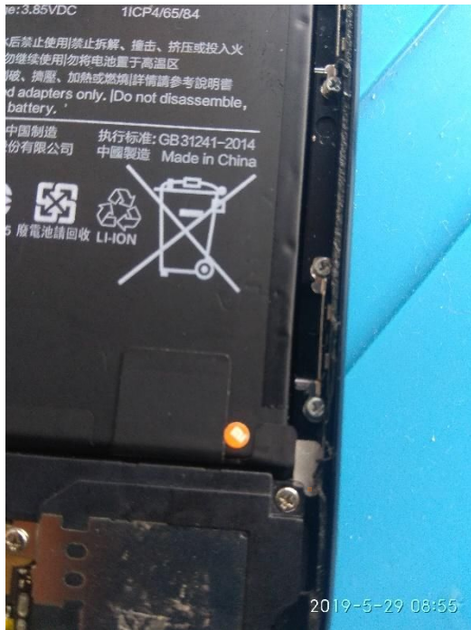
Imagem 5: lacre de parafuso retirado do lugar FALTANDO A ETIQUETA DO IMEI....