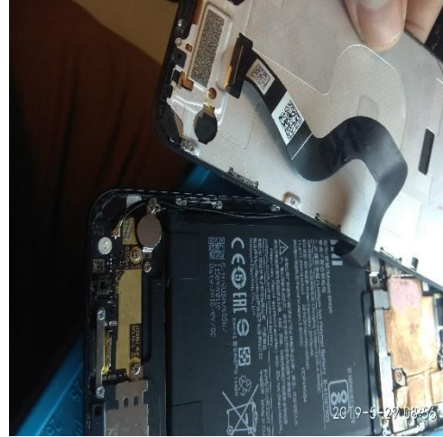
Imagem 4: cola frame de vedação faltando em vários pontos