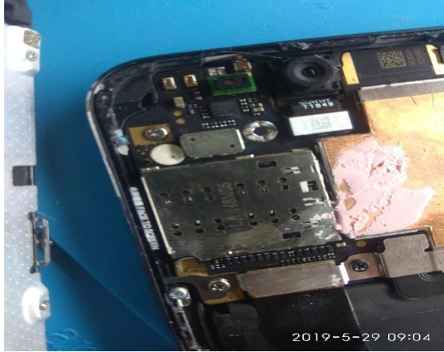
Imagem 3: parafuso não original